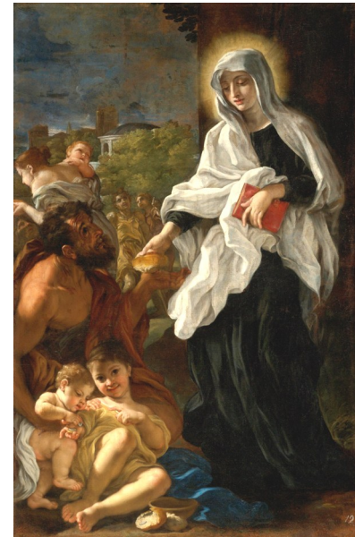
Santa Francisca de Roma 1384-1440

Cuarto Domingo de Cuaresma Domingo de Laetare 15 de marzo de 2026