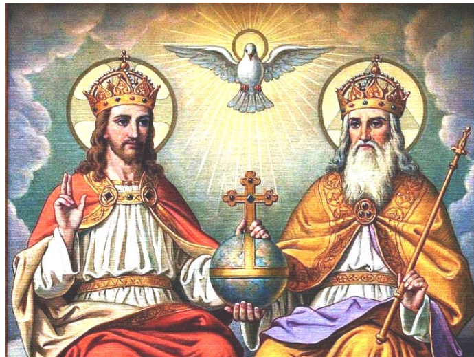
“Gloria al Padre y al Hijo y al Espíritu Santo.” Apocalipsis 1, 8