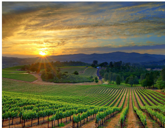
"Señor, Dios de los ejércitos, restáuranos." Sal 80:19

Vigésimo séptimo domingo del tiempo ordinario 8 de octubre de 2023